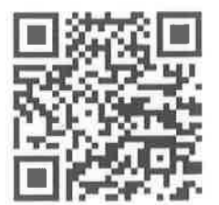
ลงทะเบียนเข้าอบรม หลักสูตร การพยาบาลจักษุชุมชน 2567

*** พยาบาลวิชาชีพที่ปฏิบัติงานโรงพยาบาลชุมชน และ โรงพยาบาลส่งเสริมสุขภาพตำบลในเขต สุขภาพ 1, 6 และ 11 โดยแบ่งเขตสุขภาพละ 50 คน (จังหวัดละ 4 - 6 คน) รวมทั้ง 3 เขตสุขภาพ จำนวน 150 คน