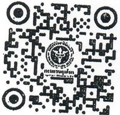
QR code ลงนามปฏิญาณตน