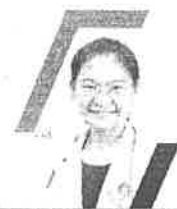
พ.ว.ดร.ปองปณ ธีระวิธาน