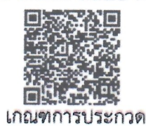
เกณฑ์การประภท

สำนักงานสาธารณสุขจังหวัดชลบุรี กลุ่มงานควบคุมโรคไม่ติดต่อฯ (ภารกิจด้านสุขภาพจิตและยาเสพติด) โทร.๐ ๓๘๘๓ ๒๔๕๐ ต่อ ๒๔๘๓