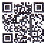
แบบเก็บข้อมูลฯ