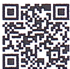
คู่มือการใช้งานฯ