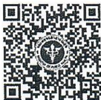
QR code สำหรับลงทะเบียน

หมายเหตุ : - กำหนดการอาจเปลี่ยนแปลงได้ตามความเหมาะสม