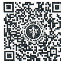
ZOOM Cloud Meeting