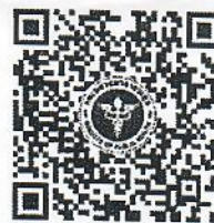
ZOOM Cloud Meeting