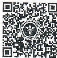
QR code สำหรับลงทะเบียน

หมายเหตุ : - กำหนดการอาจเปลี่ยนแปลงได้ตามความเหมาะสม