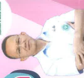
นายสมศักดิ์ เทพสุทิน รัฐมนตรีว่าการกระทรวงสาธารณสุข