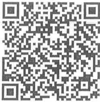
QR code ลงทะเบียน

๙.๑ กรอกใบสมัครเข้าร่วมโครงการ แสกน QR Code เพื่กรอกใบสมัคร และตรวจสอบรายชื่อ