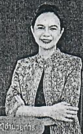
คณาจารย์